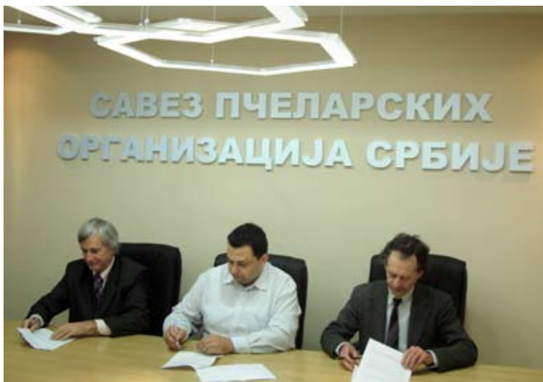
Potpisivanje ugovora Apimondije i Saveza pčelarskih organizacija Srbije o organizovanju Simpozijuma APIECOTECH 2012

Predsednik Lokalnog organizacionog komiteta simpozijuma